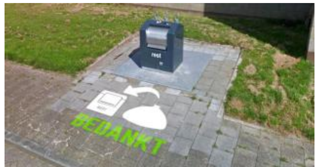
Campagne voor een schone buurt