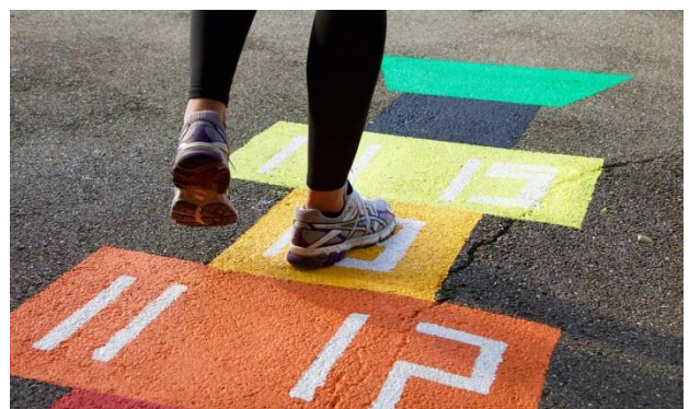
Sport en spel in de buurt door grondschilderingen