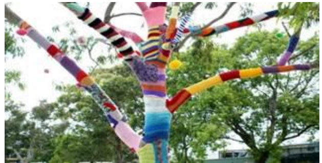
Kunstwerken in de openbare ruimte