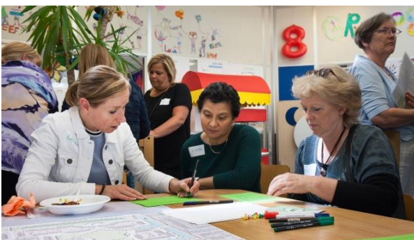
Verbeterplannen worden gemaakt tijdens het buurtevent op 23 juni 2018.

In het vorige buurtbericht lieten wij u weten dat het college van burgemeester en wethouders een aanpak en een budget had voorgesteld aan de gemeenteraad, voor vernieuwing van de openbare ruimte in Schansen-Noord. Onderdeel van dat voorstel is de kansenkaart die samen met de buurt is opgesteld. De gemeenteraad ging op 11 oktober akkoord met de verdere uitwerking van de kansenkaart naar een plan voor de vernieuwing van uw buurt en stelt hiervoor €5.900.000,- beschikbaar. Met dit budget kan de gemeente samen met inwoners, ondernemers en maatschappelijke partners aan de slag met het uitwerken van ideeën voor het vernieuwen van de bestrating, verlichting, parkeerterreinen, het groen en de speelplekken. 2019 staat dan ook in het teken van het samen ontwerpen van een prettige leefomgeving voor uw buurt. In dit buurtbericht leest u meer over hoe de gemeente dit Betere Buurten traject wil uitwerken en hoe u kunt meedoen. Ook leest u meer over projecten die al lopen en nodigen wij u uit voor een gemeenschappelijke aftrap voor het nieuwe jaar!