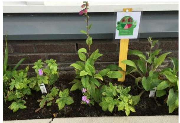
Geveltuinen aanleggen in de straat